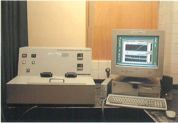
一次元フォトン計測装置 (マルチサンプルフォトンカウンティングシステムI、浜松ホトニクス社製)