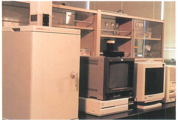
二次元フォトン計測装置 (アルガス-50、浜松ホトニクス社製)