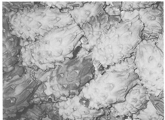
イエローピタヤ生果実