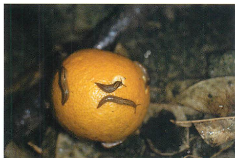
①カンキツ果実を加害するチャコウラナメクジ