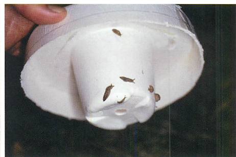
⑤銅無返し有ポット