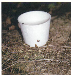
④紙タイプの資材 (銅無バリ無ポット)