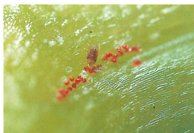
①オンシツヒメハダニ 雌成虫と卵 (シンビジュームの花柄) (川村 満氏原図)