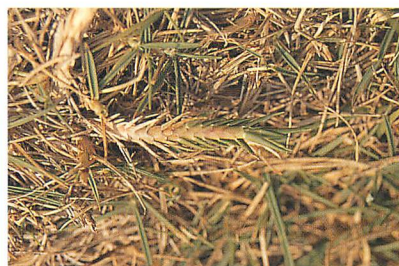
④シバホソヒメハダニの加害による奇形茎葉 (コウシュンシバ) (赤嶺 光氏原図)