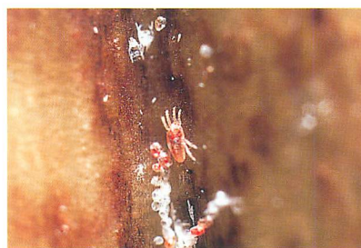
②オンシツヒメハダニ 雌成虫と幼虫脱殻後の白い卵殻 (シンビジュームの花苞) (川村 満氏原図)