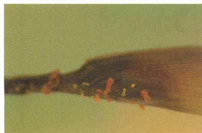
③シバホソヒメハダニのコロニー (コウシュンシバ) (赤嶺 光氏原図)