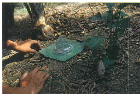
②フィルムタイプの資材の試験方法