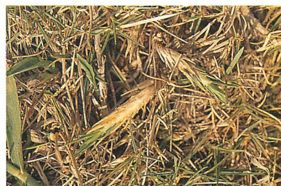
⑤同左 (赤嶺 光氏原図)