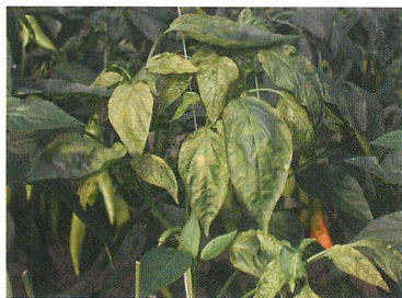
①ピーマン退緑斑紋ウイルス(CaCV)