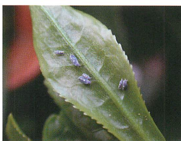
②新葉の裏に静止する成虫