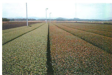
③未完熟堆肥施用茶園での赤焼病の激発 左：ゆたかみどり、右：かなやみどり