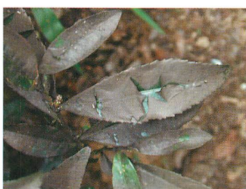
⑤すす病の発生状況