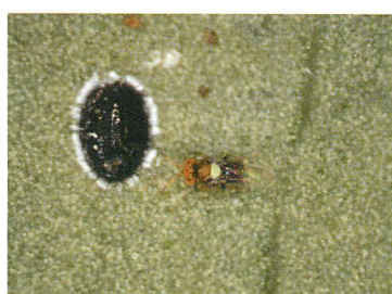
⑥シルベストリコバチ成虫及び本虫蛹殻