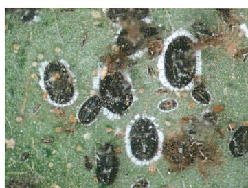
③卵および幼虫・蛹