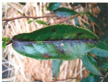
①典型的な赤焼病の病徴