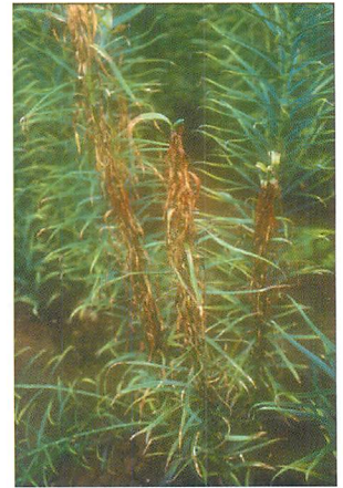
③えそ病による枯死