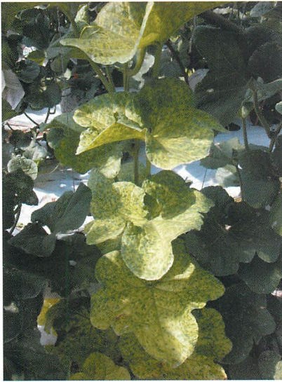
①メロン退緑黄化病