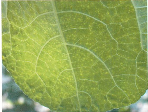
④メロンにおける退緑小斑点