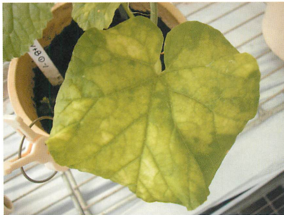
③メロンにおける大型黄斑