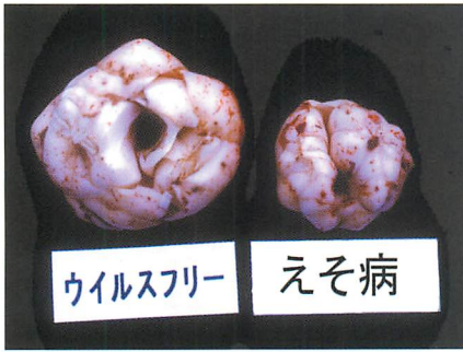
①ウイルスフリー球とえそ病感染球の リン茎肥大の差