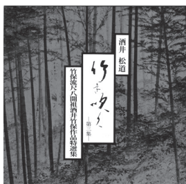
「虫供養」が収録されたCD 酒井松道 竹を吹く第三集 SS-1003～5

供養碑の前に供養祭が開かれることがあり、「虫塚」でも「虫供養」を行うところがある。〈虫供養〉という曲があることを知ったので早速CDを取り寄せた。虫の曲をいろいろ聴いてきた私にも〈虫供養〉は初めてである。尺八の竹保流の創始者である酒井竹保（1892～1984）が1956年に作った曲で、CDの解説書によると、戦前に箕面の西江寺の境内で大阪在住の文人や芸能人を集めて開かれた虫の声を聴く会の折に着想され、鳴く虫の音とはかなさを思い虫の命に祈りを捧げたものだという。