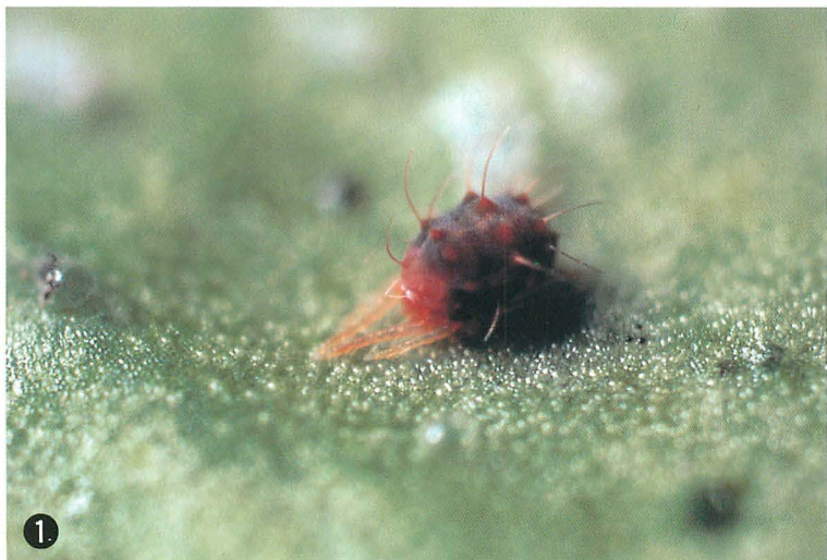
① ミカンハダニ成虫