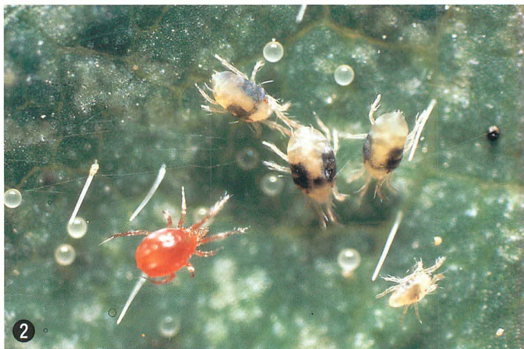
② ナミハダニ (右) とチリカブリダニ (左: 赤色) の成虫