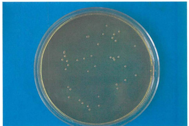
SPS培地上での P. syringae のコロニー