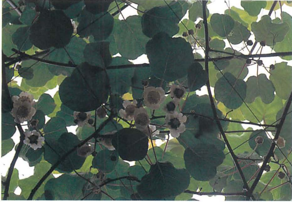
圃場における発病状況