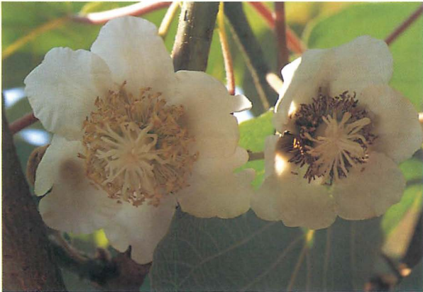
花における症状(右:発病花(葯の黒変)、左:健全)