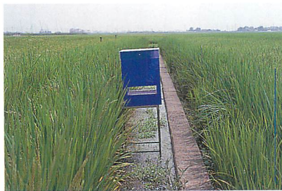
昆虫誘引捕獲器 (千本木市夫氏原図)