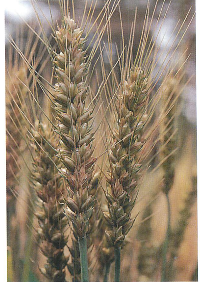
日本の抵抗性育成系統「西海165号」と圃場における病徴