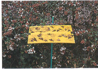
白花系アベリアと黄色トラップ (千本木市夫氏原図)