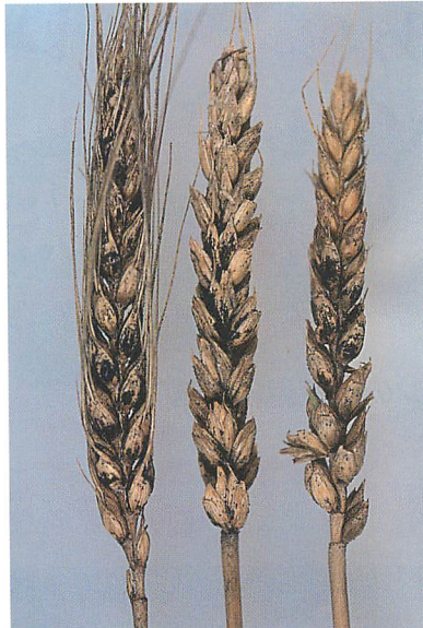
穎の表面に形成されたカサブタ (scabbed appearance) 状の子のう殻