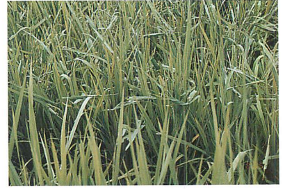
苞数3~4個/株の現地農家の被害水田 (8月中旬) (千本木市夫氏原図)