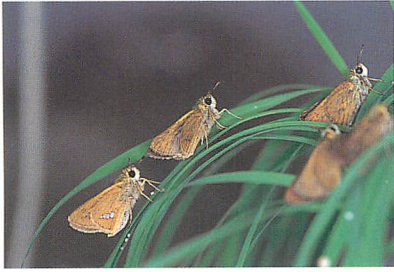
採卵苗に止まる成虫 (桑澤久仁厚氏原図)