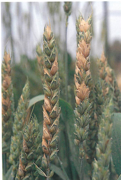
コムギ赤かび病の病徴 (罹病性品種、ASW構成品種のGamenya)