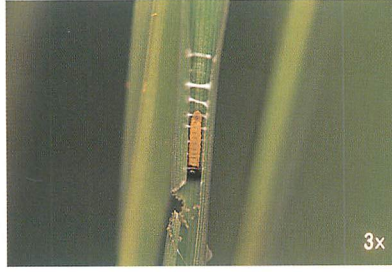
ソトを作る1齢幼虫 (桑澤久仁厚氏原図)