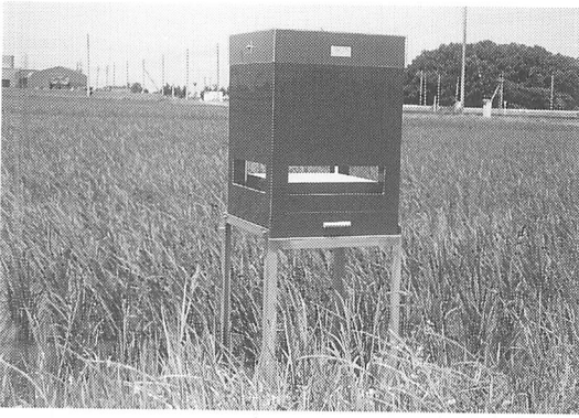
写真-2 イチモンジセセリ予察用の濃青色・香料捕獲器 (トラップ)