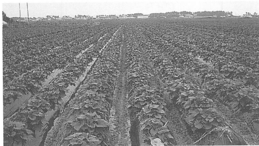
サツマイモの黒マルチ栽培

Introduction of Sweet potato and Japanese radish — Producing District in Tokushima. By Yasuo KANAISO (キーワード：砂地畑，直作障害，サツマイモ，ダイコン)