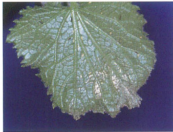
キュウリの被害葉