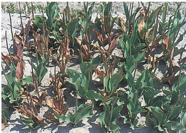
チューリップ球根腐敗病の病徴（築尾嘉章氏原図）