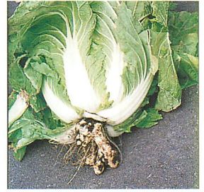
ハクサイ根こぶ病の罹病株（釘貴靖久氏原図）