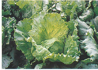
レタスビッグベイン病の病徴（川頭洋一氏原図）