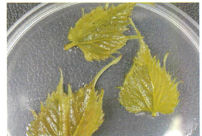
（Rupesstris du Lot：わずかに病斑が形成）