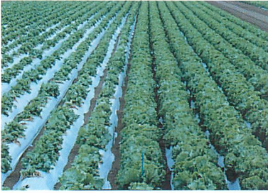
レタス根腐病発生圃場における‘長・野28号’（右）と従来種（左）（土屋宣明氏原図）