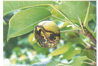
ナシ（二十世紀）幼果の黒斑病による裂果症状（寿 和夫氏原図）