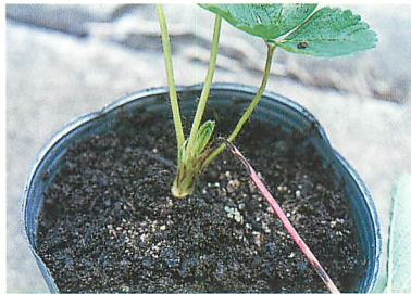
イチゴ炭疽病による葉柄の折損（森 利樹氏原図）