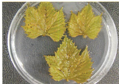
（巨峰：病斑が多数形成）