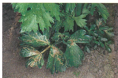
⑥セロリーの潜葉痕