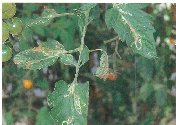
⑧トマトの被害状況