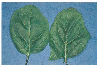
⑤ホウレンソウの潜葉痕