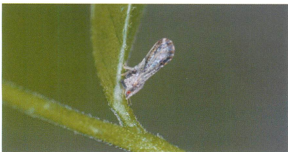
ゲッキツ上のミカンキジラミ成虫