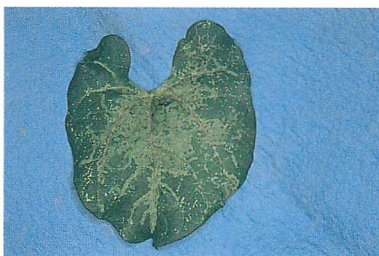
④インゲンマメの潜葉痕 (放飼)