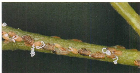
ゲッキツ上のミカンキジラミ幼虫