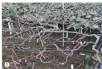
①キウイフルーツ枝枯れ症の病徴