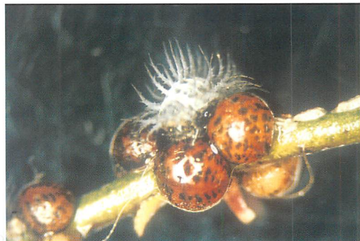
③捕食中のアカホシテントウ幼虫（拡大）（4月17日）