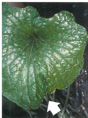
①初期症状（葉の変形）