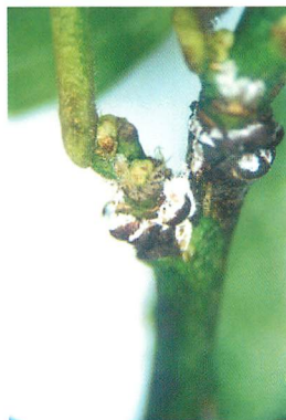
②同（枝基部・白いロウ物質で覆われている）（6月13日）