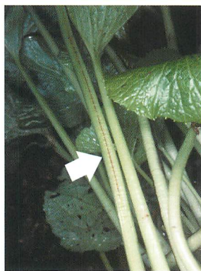
②初期症状（葉柄の傷）