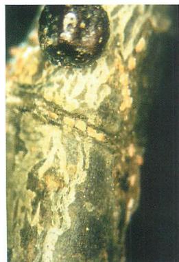
①窪みに定着した幼虫（ロウ物質分泌）（5月31日）