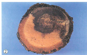
②主幹部枯れの縦断面