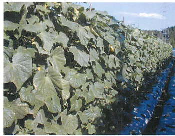
② 農家圃場における ZYMV ワクチン株2002の防除効果 ワクチン接種区 (左) と無処理区 (右).