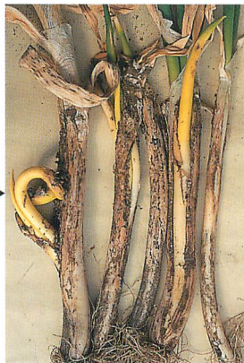
② 小菌核腐敗病に激しく侵されたネギ (亀裂部から内葉が突出することもある→)