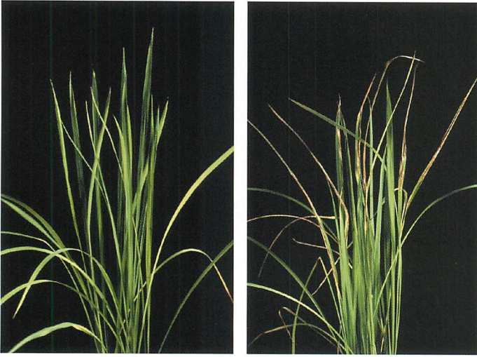
①葉面菌によるいもち病発病抑制 葉面菌処理区 対照区