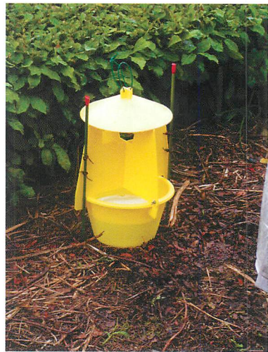
②フェロモントラップ