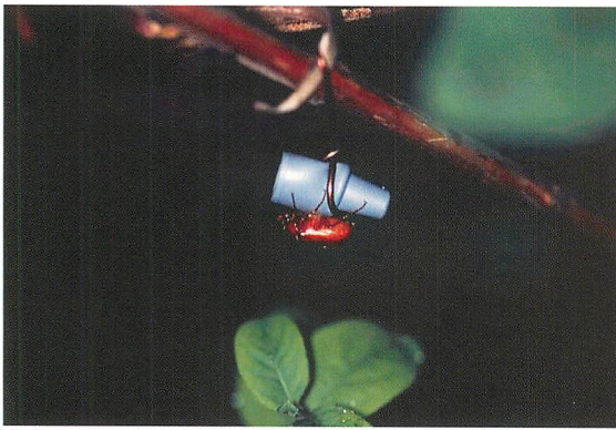
①性フェロモンに誘引されたナガチャコガネ