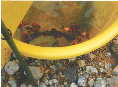
③トラップに誘引されたナガチャコガネ