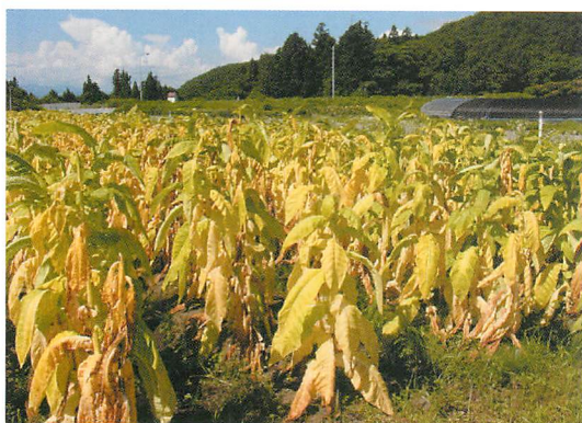
①タバコ立枯病の多発圃場