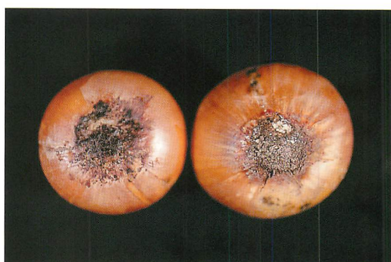
②収穫期～収穫後の病徴