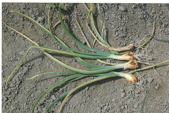
①7月頃のタマネギ乾腐病