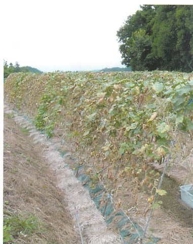
①露地キュウリに発生したホモプシス根腐病