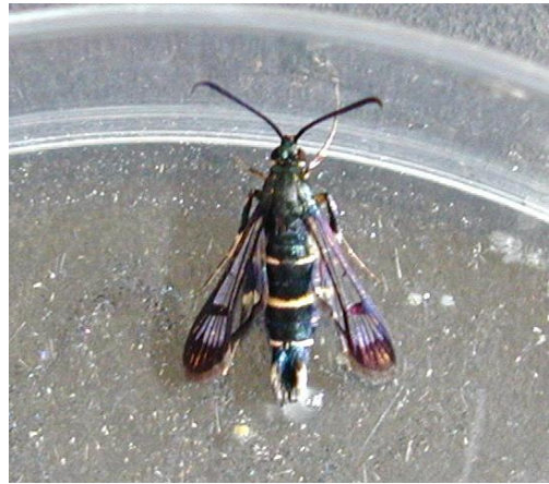
粘着板に付着したオス成虫