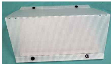
サンケイトラップ (左：組み立て前、右：組み立て後)