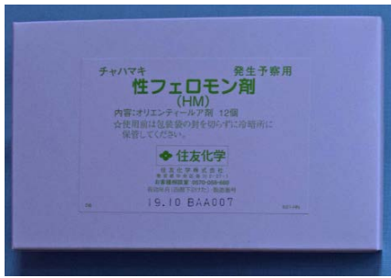
フェロモン剤が入っている箱